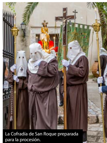
La Cofradía de San Roque preparada para la procesión.

En 1834 una epidemia de cólera arrasó la población, convirtiéndose en la más dura sufrida en la historia de la localidad. La imagen de San Roque fue colocada en la Plaza junto a otras imágenes religiosas, para que las gentes hiciesen sus rogativas. Las muertes por cólera, que habían aumentado hasta segar 295 vidas, y por fin cesaron, cerca de la festividad del 16 de agosto haciendo que la devoción al Santo aumentara en la ciudad. A finales del siglo XIX la fiesta consistía en una procesión en la que los vecinos acompañaban al Santo desde la Ermita hacia la Iglesia Parroquial y regresaba al día siguiente. En la pequeña explanada de la Ermita se celebraba una ver-