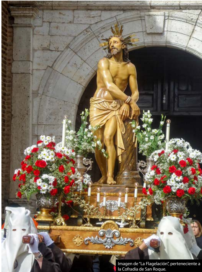
Imagen de "La Flagelación", perteneciente a la Cofradía de San Roque.