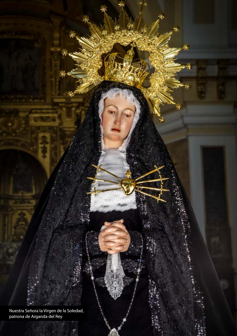
Nuestra Señora la Virgen de la Soledad, patrona de Arganda del Rey