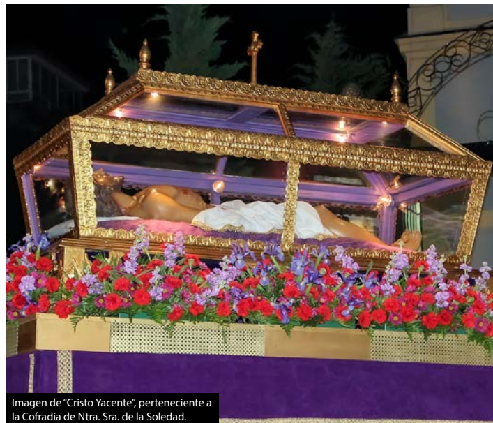
Imagen de "Cristo Yacente", perteneciente a la Cofradía de Ntra. Sra. de la Soledad.