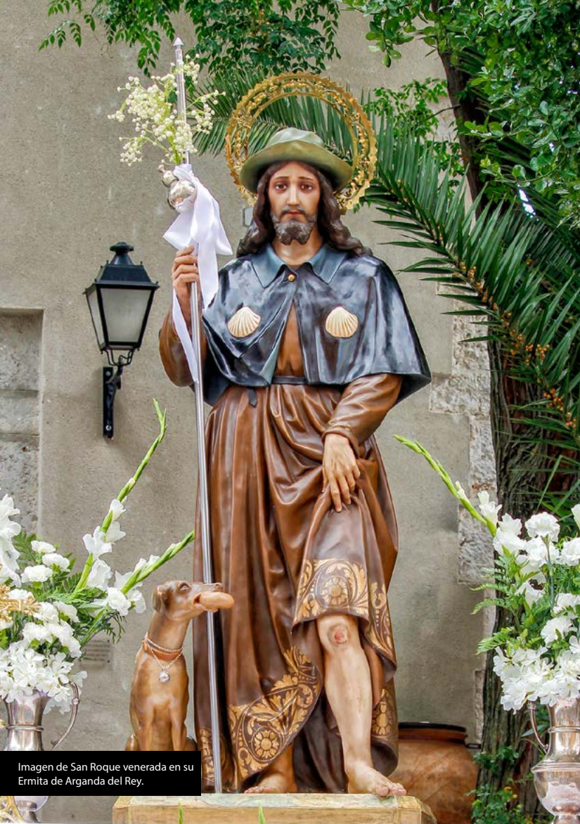
Imagen de San Roque venerada en su Ermita de Arganda del Rey.

En el año 1598 se producen inundaciones, pérdidas de cosechas y hambruna que derivan en una epidemia de peste que