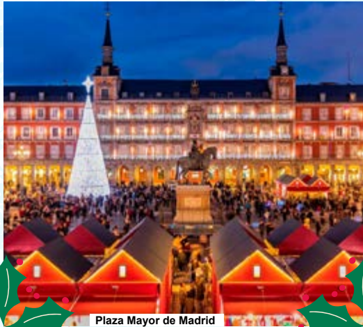
Plaza Mayor de Madrid

Salida en autocar desde Paseo de la Estación junto Metro Arganda