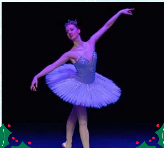
Representación de El Cascanueces