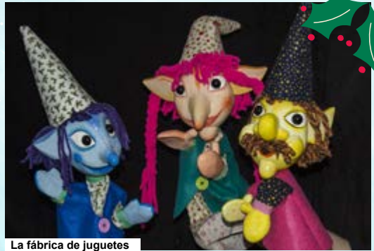
La fábrica de juguetes