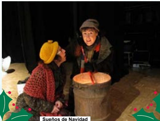
Sueños de Navidad