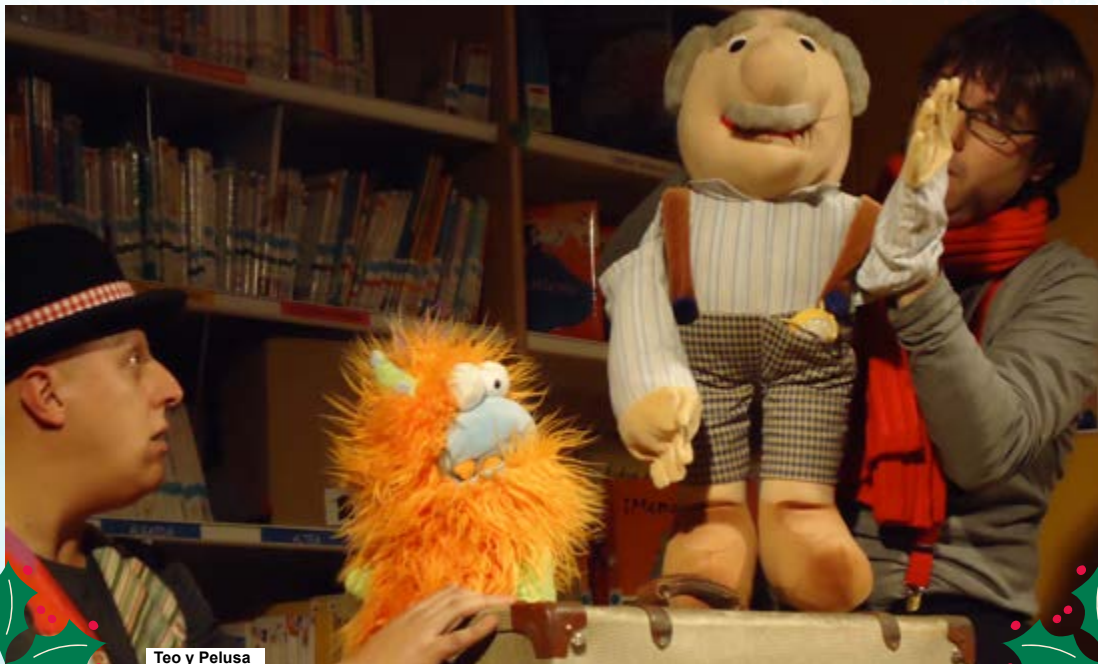
Teo y Pelusa