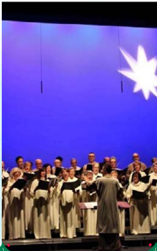
Auto de los Reyes Magos