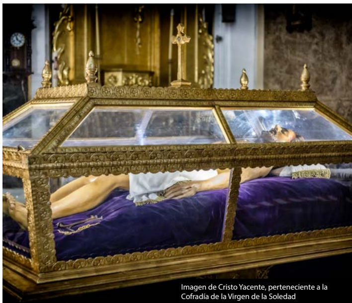
Imagen de Cristo Yacente, perteneciente a la Cofradía de la Virgen de la Soledad

Finalizada la contienda, el 28 de marzo de 1939, el vecindario en masa, lleno de fe y entusiasmo, subió al Castillo, cogió en sus brazos a la "Perla de Arganda" para bajarla a la Plaza de la Constitución. En su primera procesión, tras el conflicto fratricida, la "Reina del pueblo argandeño" fue llevada sobre una modesta camioneta engalanada de flores y luces.