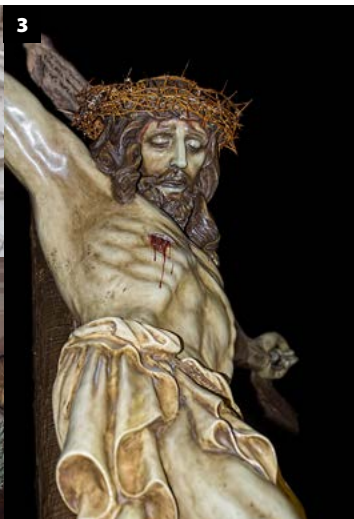
1. Jesús Narareno — 2. Oración en el huerto — 3. Cristo Crucificado