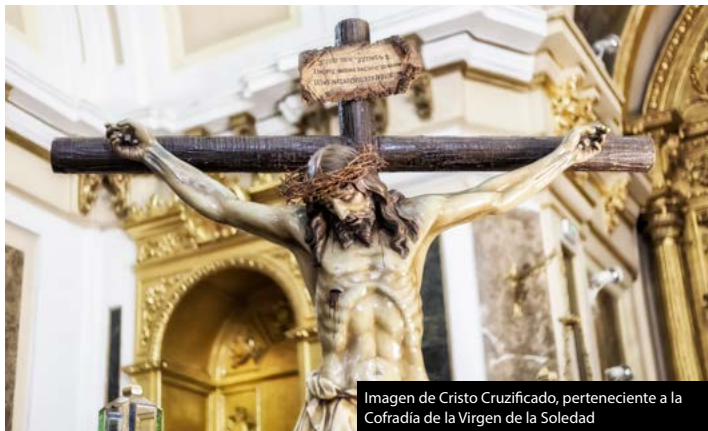
Imagen de Cristo Cruzificado, perteneciente a la Cofradía de la Virgen de la Soledad