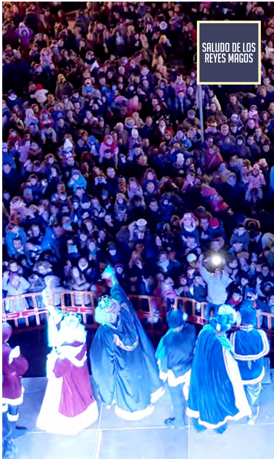
SALUDO DE LOS REYES MAGOS