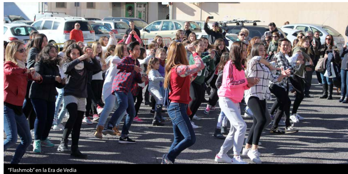
"Flashmob" en la Era de Vedia

Los primeros en recibir un recuerdo por su labor fueron los alumnos, alumnas y componentes de las AMPAS y los centros educativos de Arganda por su participación en el proyecto de recogida de tapones con la colaboración de la Fundación SEUR.