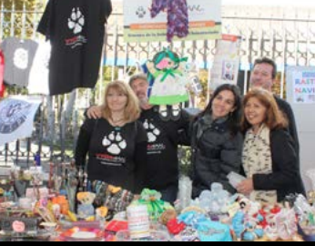
Asociación Vida Animal