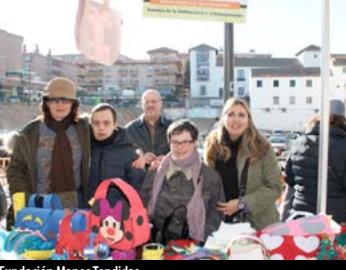
Fundación Manos Tendidas