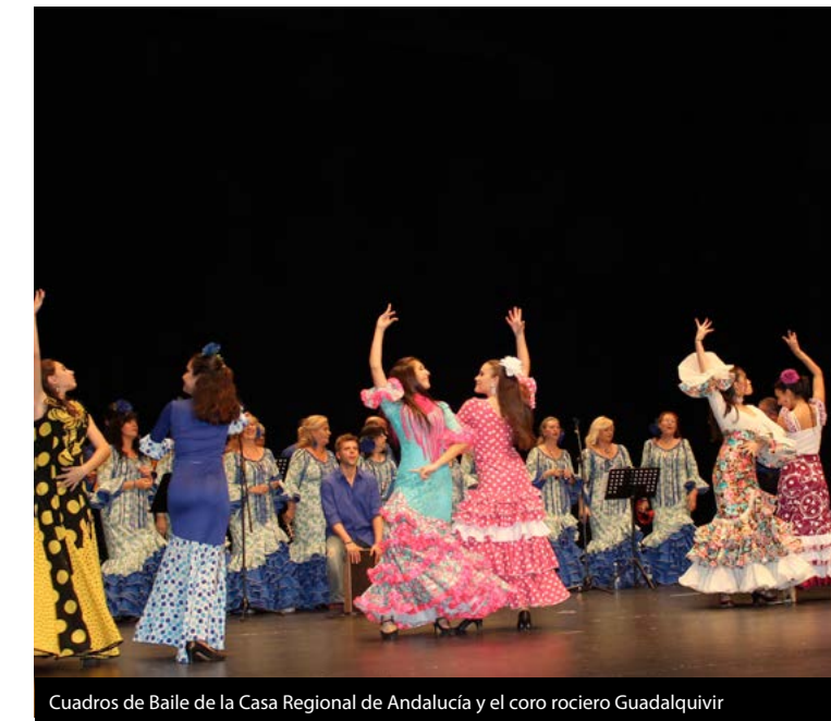
Cuadros de Baile de la Casa Regional de Andalucía y el coro rociero Guadalquivir

Después del turno de palabra, llegó el momento de las múltiples actuaciones, salpicadas por divertidos sketches de la compañía de teatro «Miel o Drama». Los encargados de romper el hielo fueron los integrantes del grupo de coros y danzas Extremadura Viva de la Casa Regional de Extremadura, seguidos