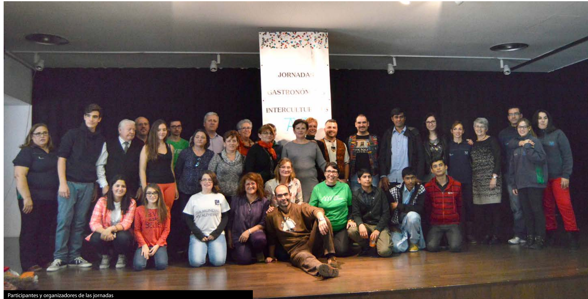
Participantes y organizadores de las jornadas