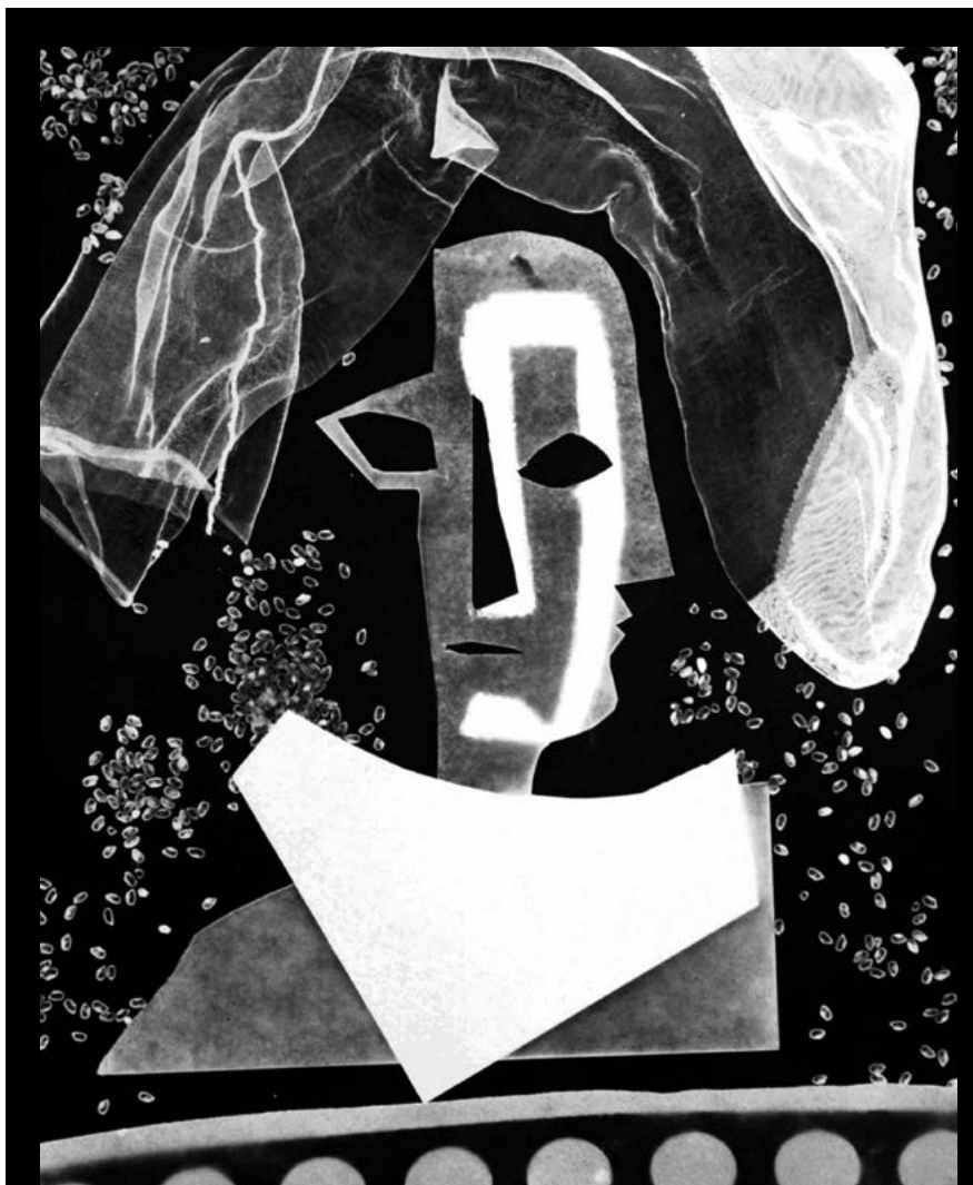
Detalle de algunas litografías expuestas en la muestra