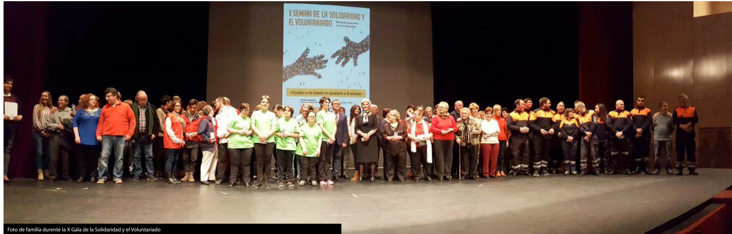
Foto de familia durante la X Gala de la Solidaridad y el Voluntariado