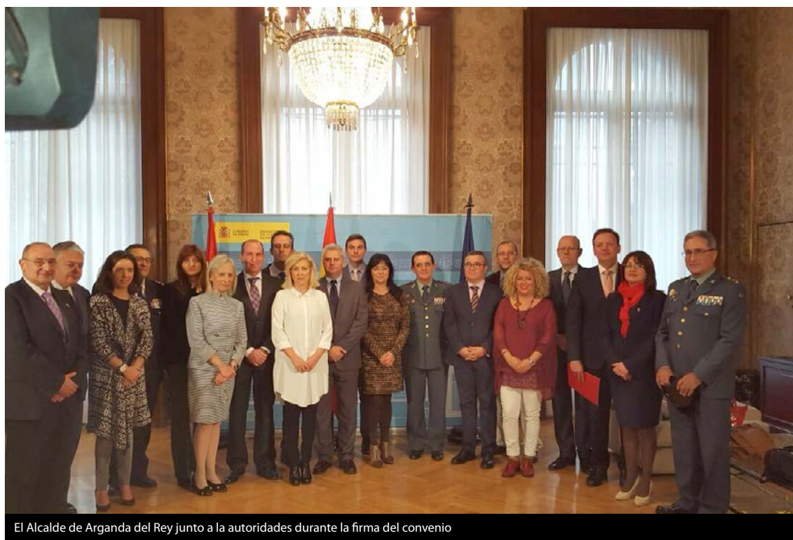
El Alcalde de Arganda del Rey junto a las autoridades durante la firma del convenio

La progresiva incorporación de la Policía Local en el sistema "Viogen" permite ofrecer a las