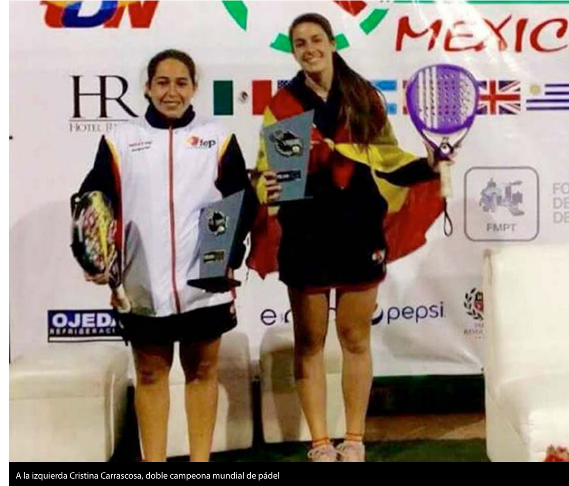
A la izquierda Cristina Carrascosa, doble campeona mundial de pádel