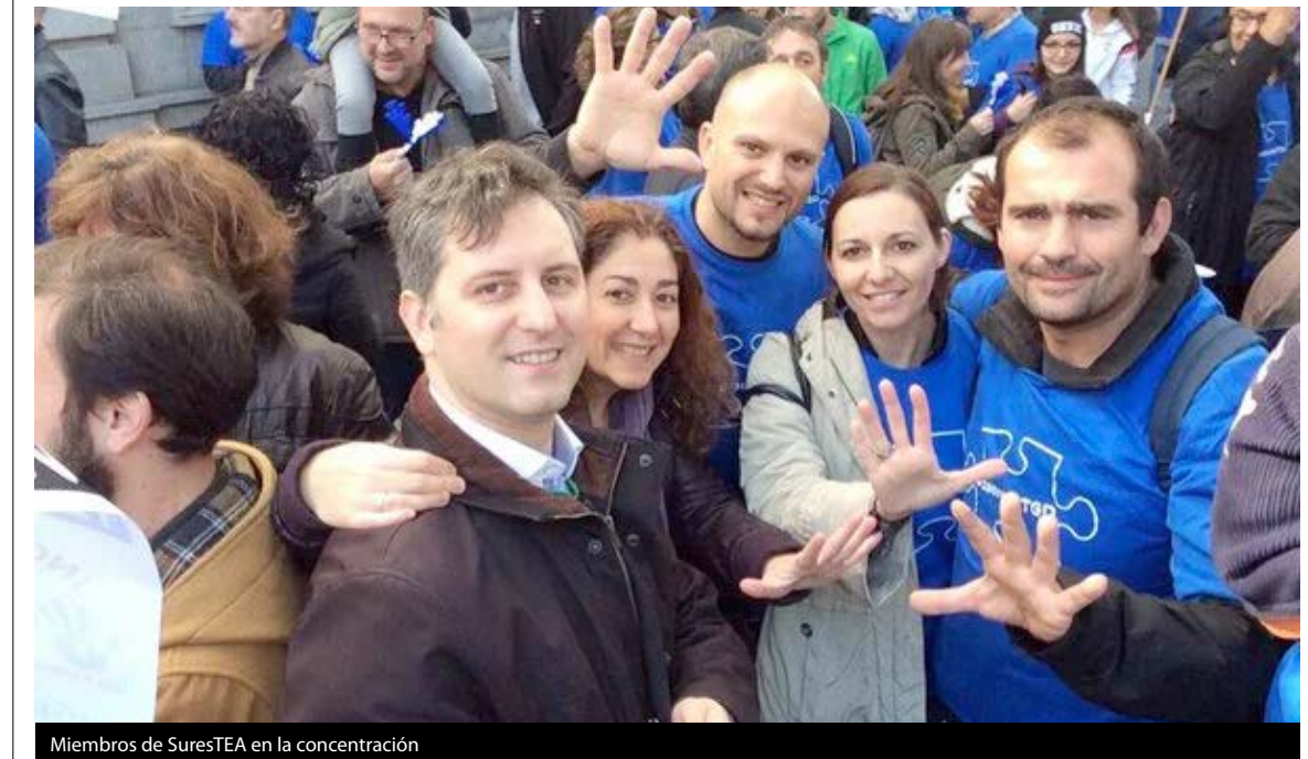
Miembros de SuresTEA en la concentración