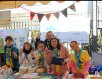
Grupo Scout San Gabriel