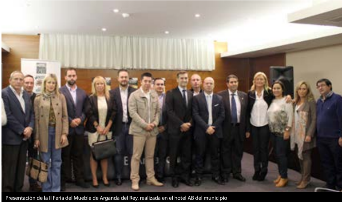
Presentación de la II Feria del Mueble de Arganda del Rey, realizada en el hotel AB del municipio