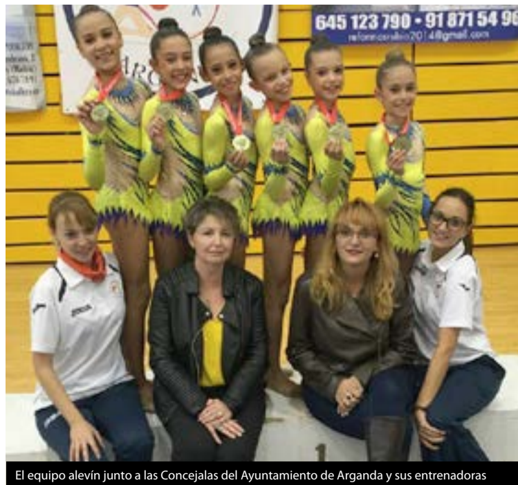
El equipo alevín junto a las Concejales del Ayuntamiento de Arganda y sus entrenadoras