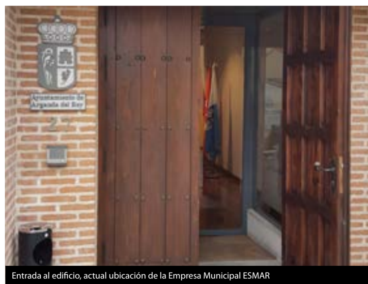
Entrada al edificio, actual ubicación de la Empresa Municipal ESMAR

Cambió de uso del edificio que, por contravenir la directriz europea y el carácter finalista por el que se adjudicaron dichos fondos, ha obligado ahora a devolver a la Unión Europea la cantidad referida a requerimiento de dicha organización. Devolución que se ha producido después de que el anterior Equipo de Gobierno desatendiera los requerimientos que se le solicitaron desde la oposición, para dar una explicación sobre el sentido y necesidad de ese cambio de uso del edificio que dejó a Arganda sin Museo del Vino a los pocos meses de su inauguración.