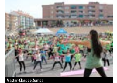
Master-Class de Zumba