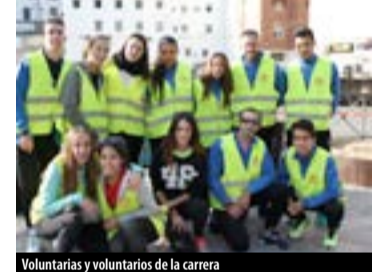
Voluntarios y voluntarias de la carrera