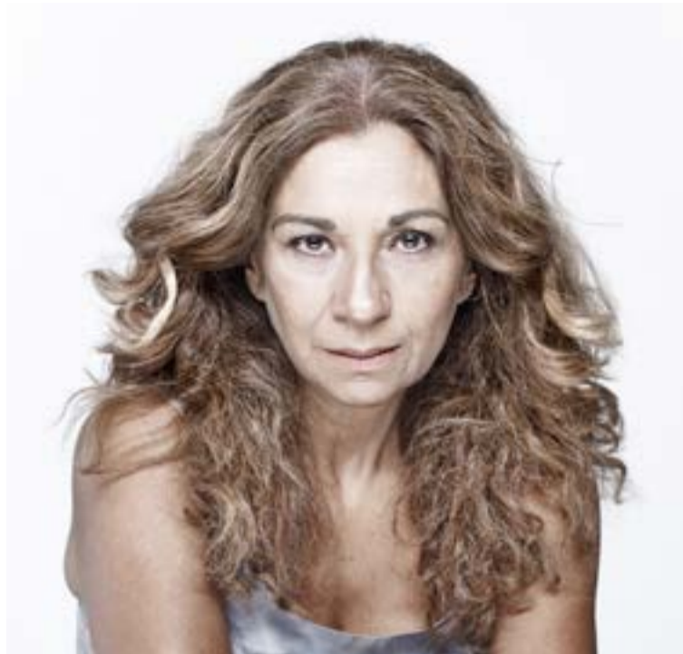
Lolita Flores actuará el 7 de noviembre en Arganda del Rey

Pues mira, gracias a Dios, las mujeres de hoy ya tienen voz y