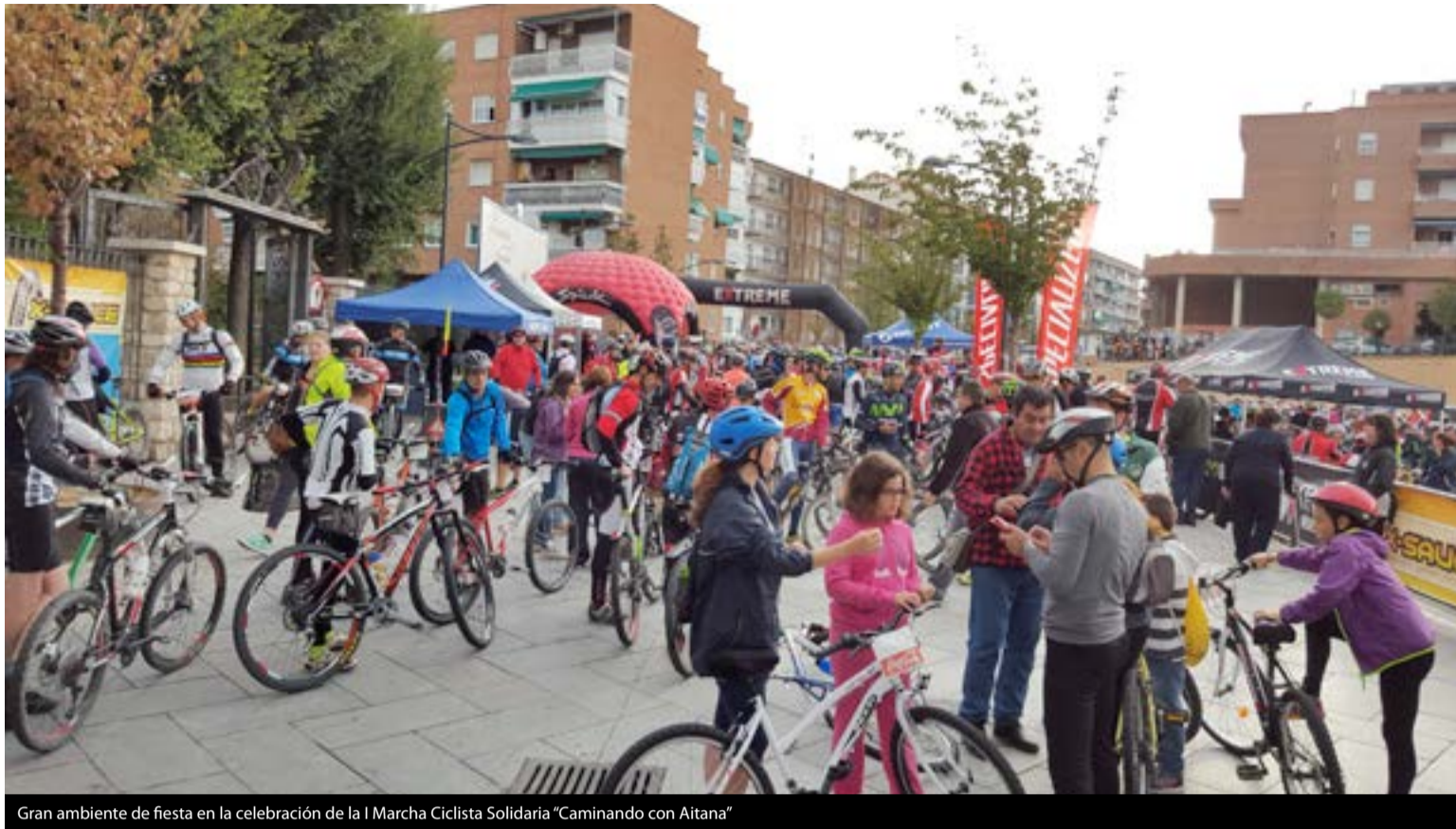
Gran ambiente de fiesta en la celebración de la I Marcha Ciclista Solidaria "Caminando con Aitana"