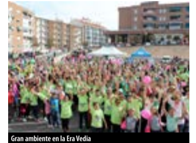
Gran ambiente en la Era Vedia

Arganda del Rey respondió de una manera masiva a la I Carrera contra el Cáncer celebrada el domingo 25, organizada por la Asociación Española Contra el Cáncer (AECC) con la colaboración del Ayuntamiento. Se agotaron los 700 dorsales disponibles, pero muchas personas más se unieron a la marcha, con salida en la Plaza de la Constitución, tras la lectura de un manifiesto, y llegada en la Era Vedia, donde hubo una multitudinaria máster-class de zumba.