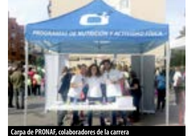
Carpa de PRONAF, colaboradores de la carrera