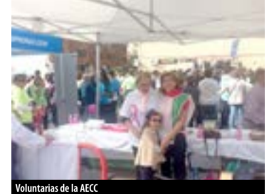
Voluntarios de la AECC