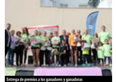
Entrega de premios a los ganadores y ganadoras