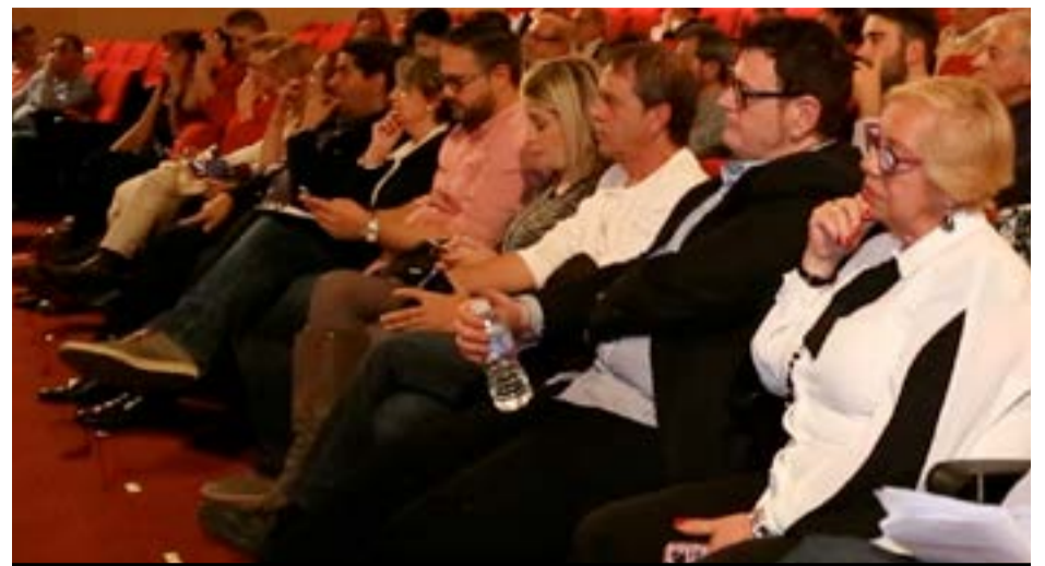
El público asistente mostró, en todo momento, gran interés en el acto

«A mi despacho vienen empresarios de Arganda con problemas, pero que quieren quedarse aquí y ampliar sus negocios»