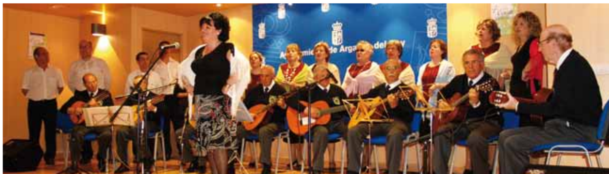
Una de las actuaciones del IV Encuentro Coral de Primavera.

Los vecinos de Arganda del Rey han podido disfrutar recientemente, en el Centro Integrado de la Poveda, del IV Encuentro Coral de Primavera.