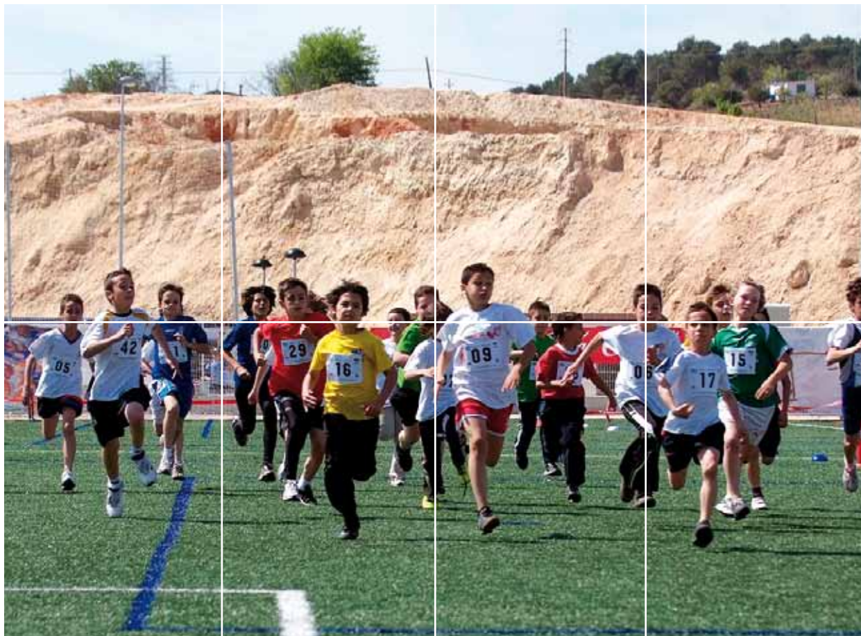
Participantes en la prueba de Cross el día de la clausura.