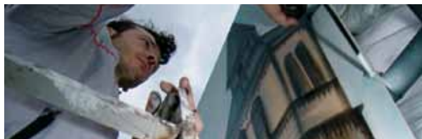
Muestra en vivo de pintura urbana.

Nuevo éxito de la Semana de la Juventud 2010 que este año ha estado dedicada a la cultura africana y se ha celebrado, con un completo programa de actividades, del 3 al 9 de mayo. Una vez más, el Ayuntamiento de Arganda del Rey, a través de la Concejalía de Educación, Cultura y Juventud, ha sido el impulsor de esta iniciativa.