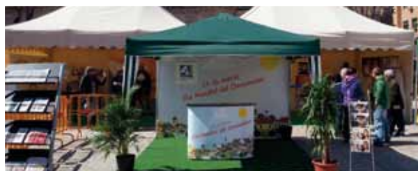
Imagen de la carpa instalada en la Plaza de la Constitución.

que durante dos días abrieron sus puertas a las 9:30 horas y cerraron a las 18:00 horas. Los niños y niñas estuvieron guiados por un monitor que les dio las explicaciones correspondientes y respondió las cuestiones que se plantearon.