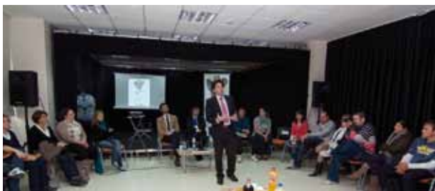
Café de Voluntarios.

Nuevo éxito de la Semana de la Juventud 2010 que este año ha estado dedicada a la cultura africana y se ha celebrado, con un completo programa de actividades, del 3 al 9 de mayo. Una vez más, el Ayuntamiento de Arganda del Rey, a través de la Concejalía de Educación, Cultura y Juventud, ha sido el impulsor de esta iniciativa.