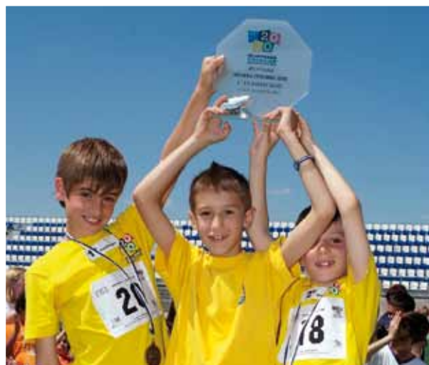
Imagen de varios de los participantes premiados durante la XIII Olimpiada Escolar.

Este año, el deporte que ha contado con mayor número de participantes ha sido el fútbol, con 776 jóvenes, inscritos en las diferentes competiciones, seguido del atletismo, con 692 deportistas; 685 en fútbol-sala y 404 en natación.