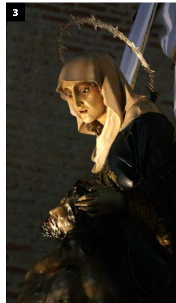
1. Jesús Nazareno — 2. La Flagelación — 3. El Descendimiento